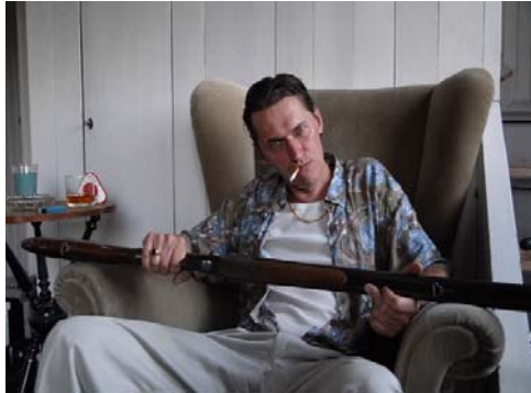
Fotograma de "Die Beauty", de Stina Bergman