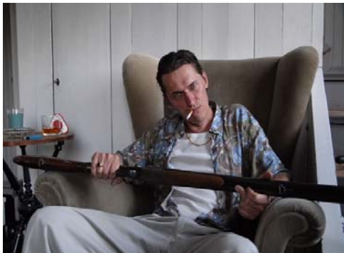
Fotograma de "Die Beauty", de Stina Bergman