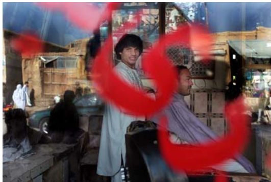
Fotograma de "Vida diaria en Kabul", de Alberto Arce

La celebració d'aquesta edició del BccN és en si mateixa un èxit, ja que dobla l'espai dedicat íntegrament a programació respecte a l'any anterior: en total 800 minuts de documental, ficció i curtsmetratges presentats per videoconferència pels seus directors, un exemple de com les noves tecnologies poden suposar un valor afegit per al nou cinema i la seva audiència.