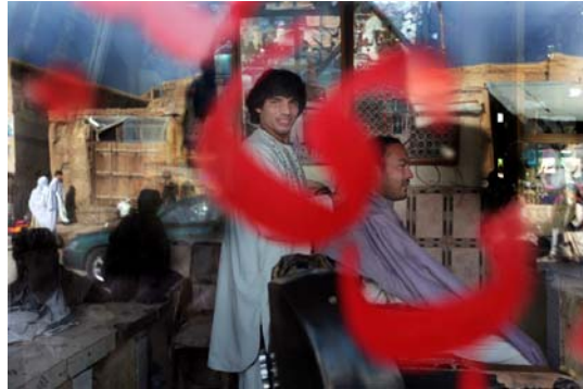
Fotograma de "Vida diaria en Kabul", de Alberto Arce

La celebración de esta edición del BccN es en sí misma un éxito, pues dobra el espacio dedicado íntegramente a programación respecto al año anterior: en total 800 minutos de documental, ficción y cortometrajes presentados por videoconferencia por sus directores, un ejemplo de cómo las nuevas tecnologías pueden suponer un valor añadido para el nuevo cine y su audiencia.